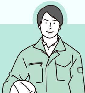
多能工 20代 K