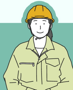
工事部長/現場指揮監督 50代 M・A

面接で会った社長の強烈な個性と熱意に心を動かされ、共感したことが入社を決めた大きな理由でした。建物の竣工までを支え、汚れが綺麗になる瞬間を見られる仕事は、とてもやりがいがあります。最近は若手メンバーも増えて、みんな向上心が強く、新しいことに挑戦する意欲にあふれています。新しいことに挑戦するのは大変だけど、責任と誇りを持って、一緒に成長していきましょう！