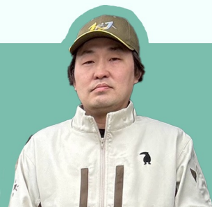
多能工 40代 Y・T

周りの仲間たちの熱意も高く、技術面だけでなく人間的な成長もできるので、自信を持っておすすめできる職場ですよ！